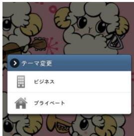
めいぶるちゃん

テーマ変更機能は「&HOMEアプリ」の独自機能です。このボタンをクリックすると、テーマ選択ウィンドウが表示されて、「ビジネス⇄プライベート」の切り替えができます。